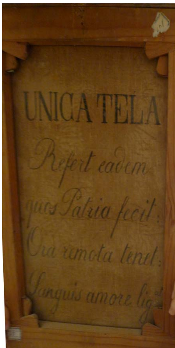
Figura 3. Iscrizione retrostante la tela col ritratto di M. Monaco, Museo Provinciale Campano (forse 1870 circa).

Ad oggi, tra i 20 ritratti censiti nella schedatura “ufficiale” delle opere risultano solo i ritratti di Monaco e di Francesco Antonio Aiossa, entrambi con le stesse dimensioni (con misure coerenti con quelle dell’inventario del 1893, privi di attribuzione ma datati al 1640 – 1660 (Aiossa) 59 e a Monaco (1650 – 1699) 60 . Montesano 61 omette di trascrivere sia l’iscrizione dipinta in alto a sinistra «Mich. Monaco / ob. 1644» (perfettamente visibile anche nella fotografia allegata alla scheda). Ancor più incredibilmente, non trascrive l’iscrizione (certamente riferibile al XIX secolo, per ragioni di grafia) posta sul retro della tela ed esattamente coincidente con il distico riportato da Giovanni Aiossa nella nota biografica di Silvestro Aiossa che chiude il manoscritto del Museo: «UNICA TELA / Refert eadem / quos Patria fecit: Ora remota tenet / sanguis amore lig. at ».