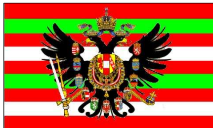
Bandiera dell'Impero Federale Mitteleuropeo

Alla fine della conferenza, Paul von Hindenburg commenta profetico: "Non abbiamo firmato una pace ma una tregua di vent'anni!"